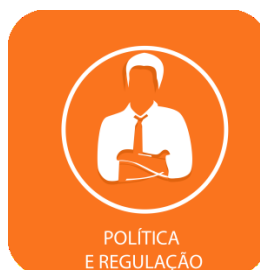
POLÍTICA E REGULAÇÃO

A partir de 2016, a cidade do Recife irá adotar um selo verde para certificar construções sustentáveis que adotarem medidas para consumir menos água, energia e aumentarem a cobertura vegetal, entre outras ações. O selo é previsto na Lei Municipal de Enfrentamento às Mudanças Climáticas, e será discutido com a sociedade com o objetivo de construir uma proposta de regulamentação do mesmo. No Recife, 15% das emissões, no