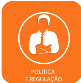
POLÍTICA E REGULAÇÃO